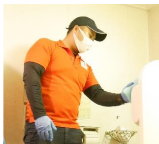
▲ユニゾン社による実習

公的3機関(アメリカ疾病センター、世界保健機構、厚生労働省)の認定した新型コロナウイルス対処方法を軸にダイヤモンドプリンセス号の除菌消毒作業を実施した実績があり、新型コロナウイルスに対する最高レベルの除菌消毒作業を提供しています。