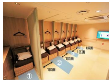
▲ツーリストの配席例(左:大阪/別府航路 右:大阪/志布志航路)