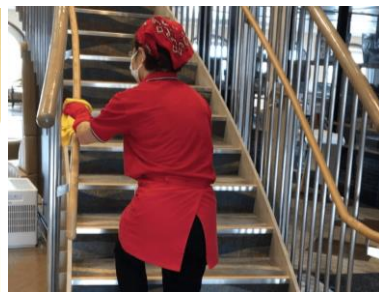
▲研修終了後の清掃・消毒風景