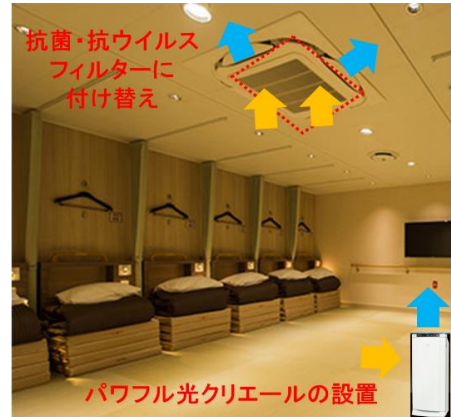
▲ツアーリストの対策例

その他当社の主な新型コロナウイルス感染予防対策の取り組みについては、次ページをご覧ください。