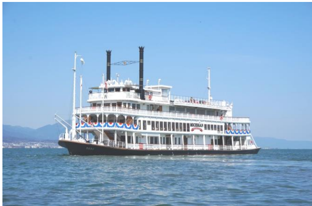
ミシガン外観(前方)

外輪船ミシガン 旅客定員:787名 全長59.0m 幅11.7m 総トン数1,046トン 進水年月1982年4月