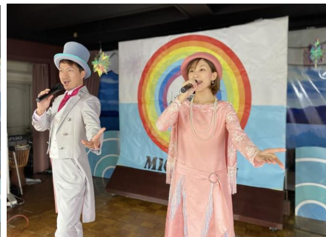
音楽ライブショーの様子