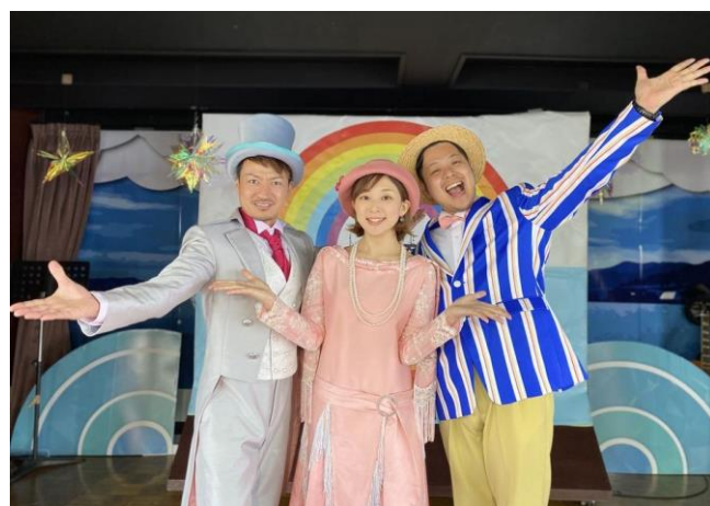
陽気なミシガンパーサー達がびわ湖の旅へのご案内